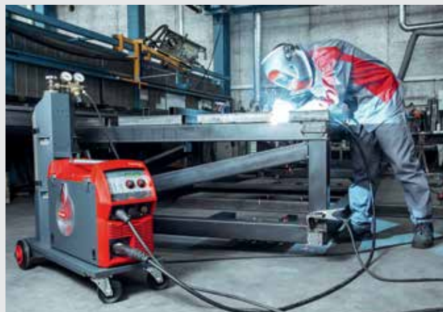
/ TransSteel 2500 Compact – výkonná a kompaktní alternativa pro práce v dílně.