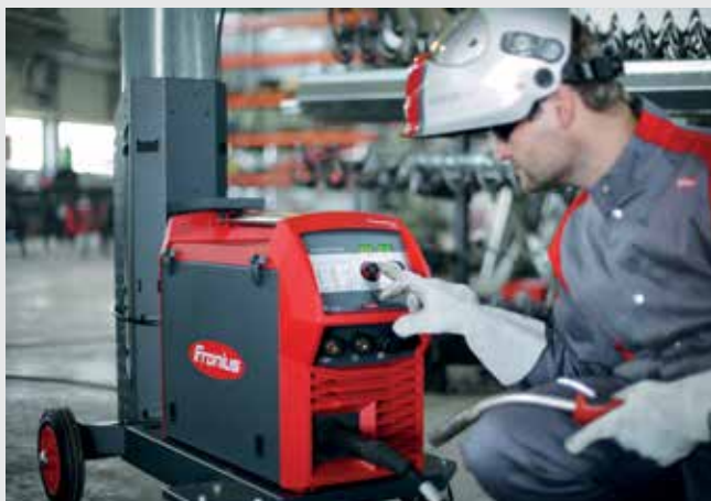
/ Dokonalé svařování oceli, digitálně řízené a odborně vyspělé.