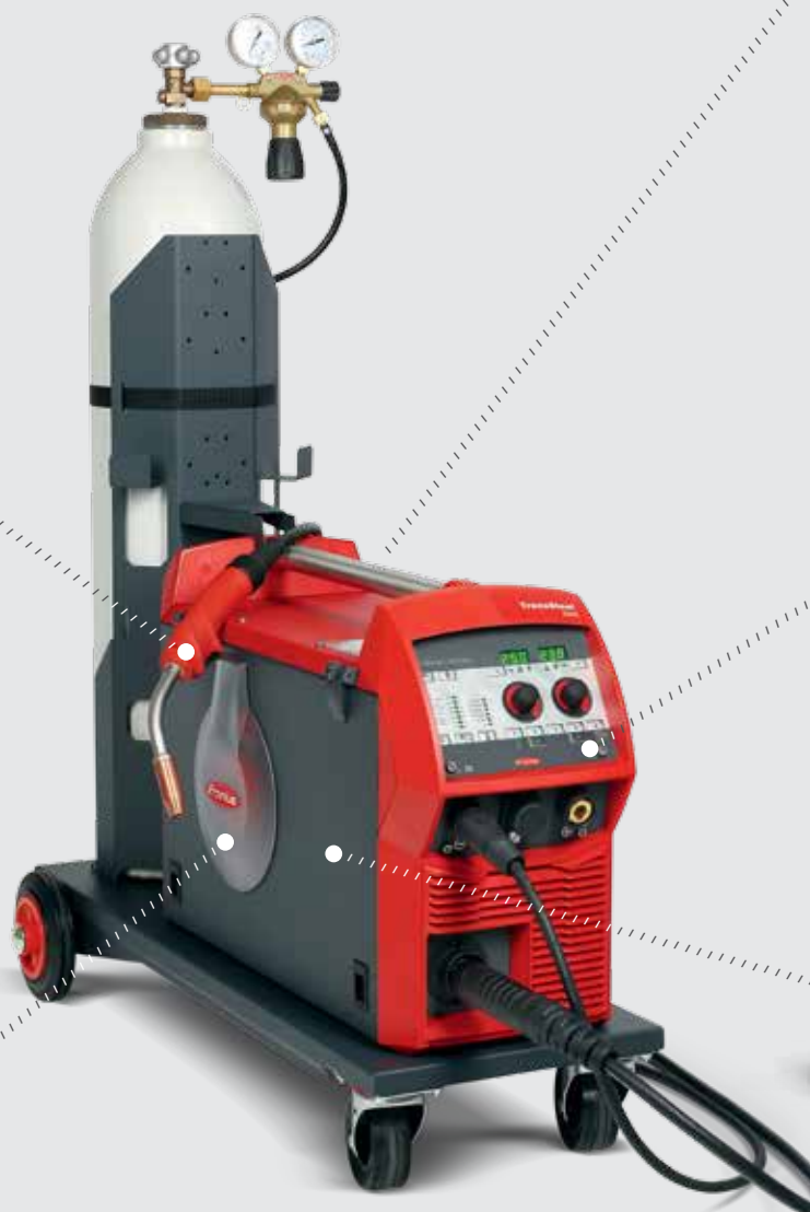
TRANSSTEEL 2500 COMPACT